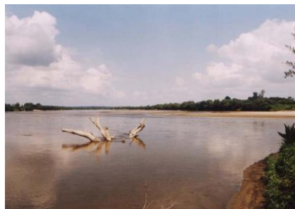
Ujście Sanu do Wisły w miejscowości Wrzawy