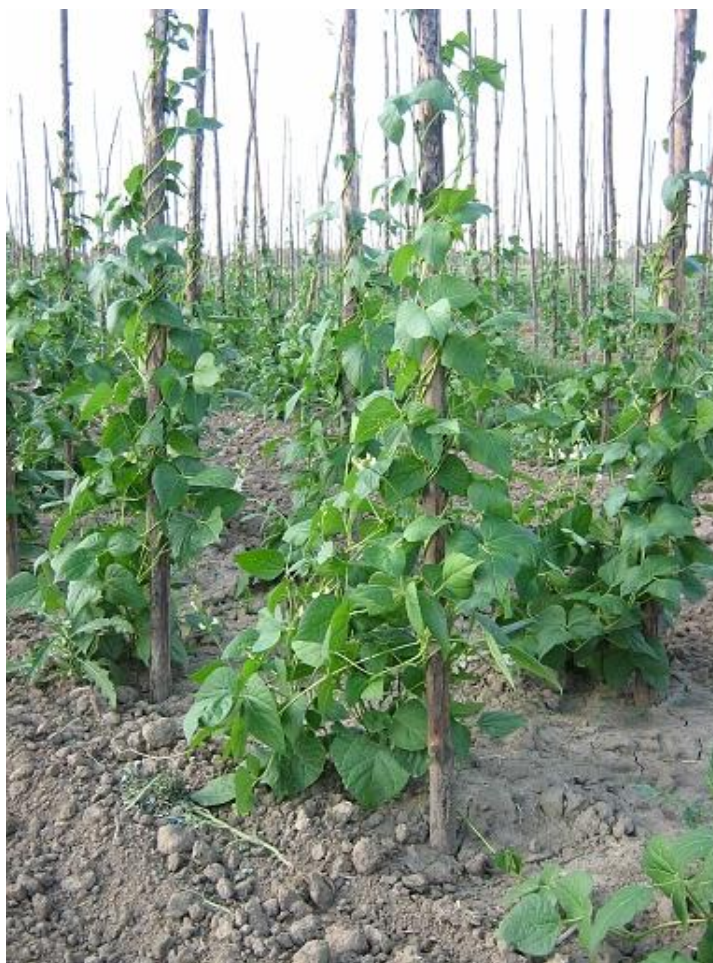
Fasola wrzawska (Piękny Jaś)

Każda z imprez „W widłach Wisły i Sanu” jest inna, chociaż łączy je wiele wspólnych elementów. Myślą przewodnią jest tutaj Fasola wrzawska - „Piękny Jaś”, główny produkt, jakim - z racji jego szczególnych walorów, szczyci się ten region.