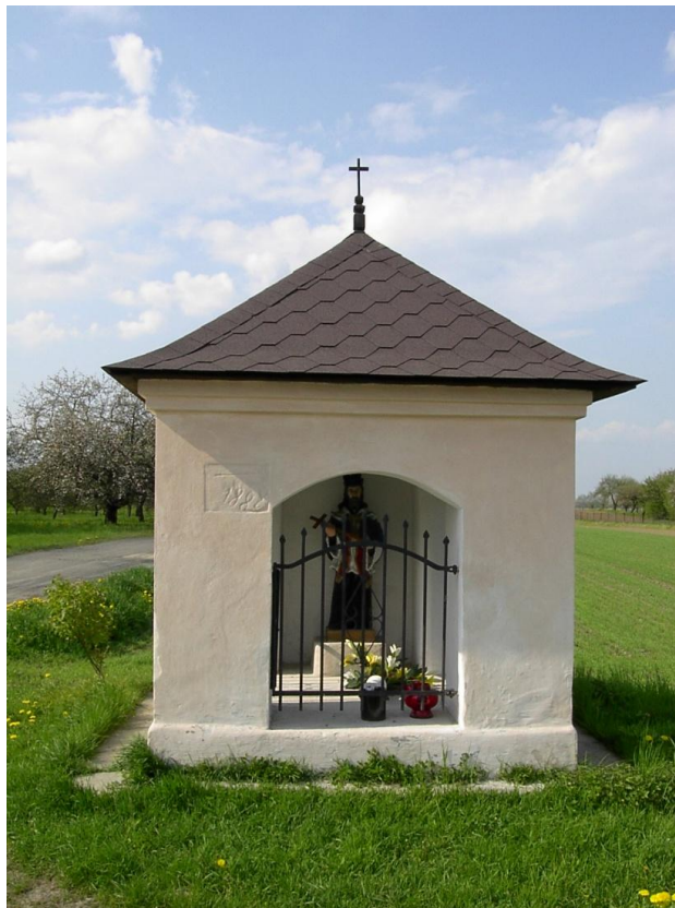
Wrzawy. Kapliczka naprzeciw cmentarza grzebalnego, mur., II poł. XIX w.

Po lewej górnej stronie kapliczki widnieje wyryty napis: 1888 , a pod nim kreska upamiętniająca stan ówczesnej wody powodziowej. Według relacji mieszkańców figura św. Jana (drewniana) znajdująca się pierwotnie w kapliczce przypląnęła Sanem podczas powodzi.